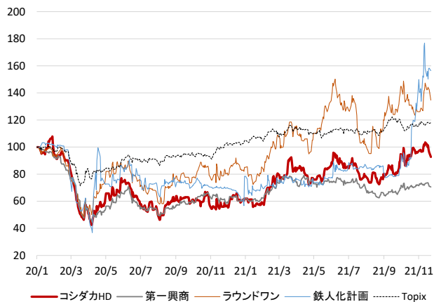
図表: カラオケ業者株価推移

注: 2019年末を100として指数化